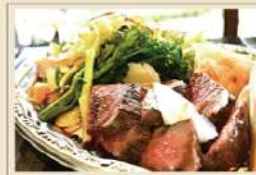
常陸牛のステーキ