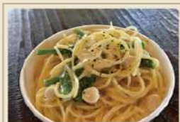
小柱とレモンクリーム