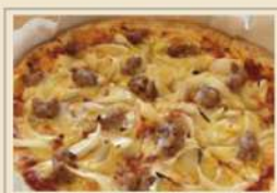
サルシッチャと玉ねぎ