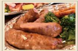
自家製ソーセージ サルシッチャ